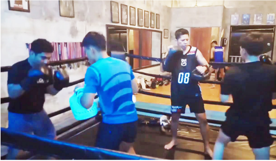
BERLATIH MUAYTHAI: Sejumlah atlet dari sasan Phenom Muaythai sedang berlatih.