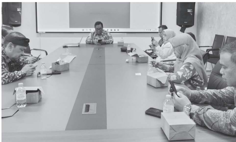
PEMERIKSAAN KESEHATAN: Sejumlah ASN peserta seleksi terbuka JPT Purwakarta menjalani pemeriksaan kesehatan di RSUD Bayu Asih.

Dalam pelaksanaannya, lima tenaga medis diturunkan untuk mendampingi para peserta, terdiri dari dokter umum, spesialis kejiwaan, hingga radiologi. Menurut pihak rumah sakit,