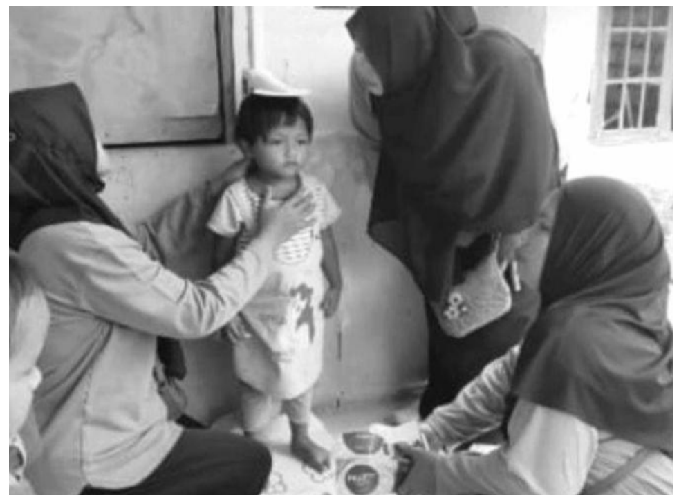
PENIMBANGAN ANAK: Pengukuran dan penimbangan berat badan anak oleh kader Posyandu Karyasari.

"Kita kader posyandu dengan senang hati bisa mengedukasi ibu hamil maupun anak-anak muda atau calon pengantin," ujarnya. (mra)