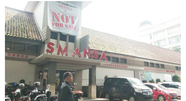
MENANG GUGATAN: Pemprov Jabar menangi gugatan SMAN 1 Bandung.