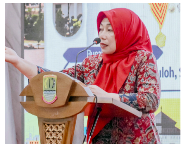
PEMBEKALAN MAGANG: Disnakertrans Kabupaten Karawang menggelar pembekalan seleksi magang Jepang gelombang 2 di Aula Husni Hamid Komplek Pemda Karawang, Kamis (11/9).