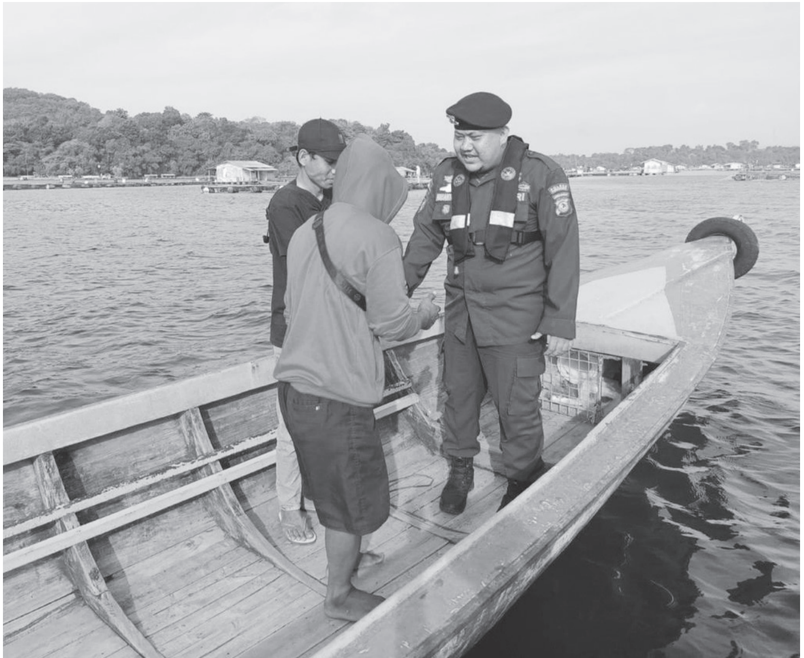
PATROLI: Satpolairud Polres Purwakarta memeriksa kelengkapan perahu milik nelayan di Waduk Jatiluhur.

Cuaca pun menjadi perhatian khusus. Satpolairud selalu mengingatkan pengemudi perahu maupun nelayan untuk memperhatikan kondisi