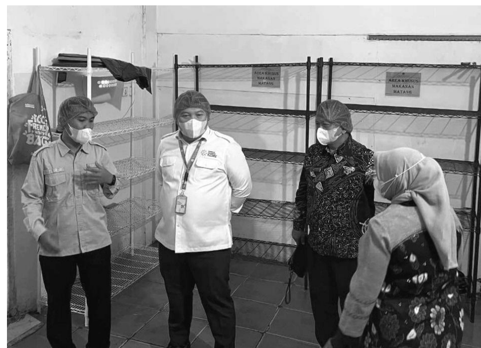
DAPUR SPPG: Rombongan BKKBN Jabar dan DPPKB Karawang mengunjungi dapur SPPG di Desa Sukaluyu.

Tak hanya fokus pada pencegahan stunting, Satpel KB juga aktif dalam pendampingan calon pengantin, ibu hamil, ibu bersalin, dan balita. Bahkan, dalam momentum HUT Karawang ke-392 sekaligus memperingati World Contraception Day, pihaknya menggelar pelayanan KB gratis berupa pemasangan IUD dan implan.