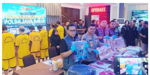
DITANGKAP: Polda Jabar tangkap pelaku korupsi dana bantuan.

POLDA Jabar mengungkap kasus dugaan korupsi penyalahgunaan dana bantuan pemerintah untuk Kelompok Wirausaha Baru (KWU) yang ditujukan bagi masyarakat terdampak Covid-19 di wilayah Karawang. ► Baca Kelompok...Hal 10