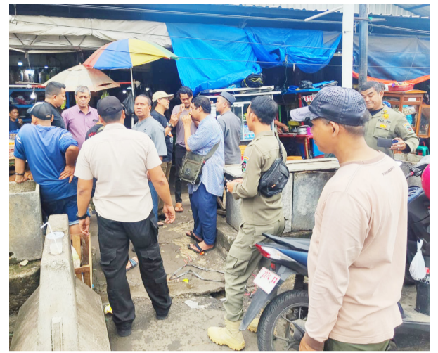
PENERTIBAN: Petugas Satpol PP Kabupaten Purwakarta menertibkan terpal yang semrawut di Pasar Rebo Purwakarta.

bahwa penertiban tidak berhenti sampai di sini. Patroli rutin akan dilakukan untuk menjaga agar Pasar Rebo tetap tertib dan bebas dari kesan kumuh.