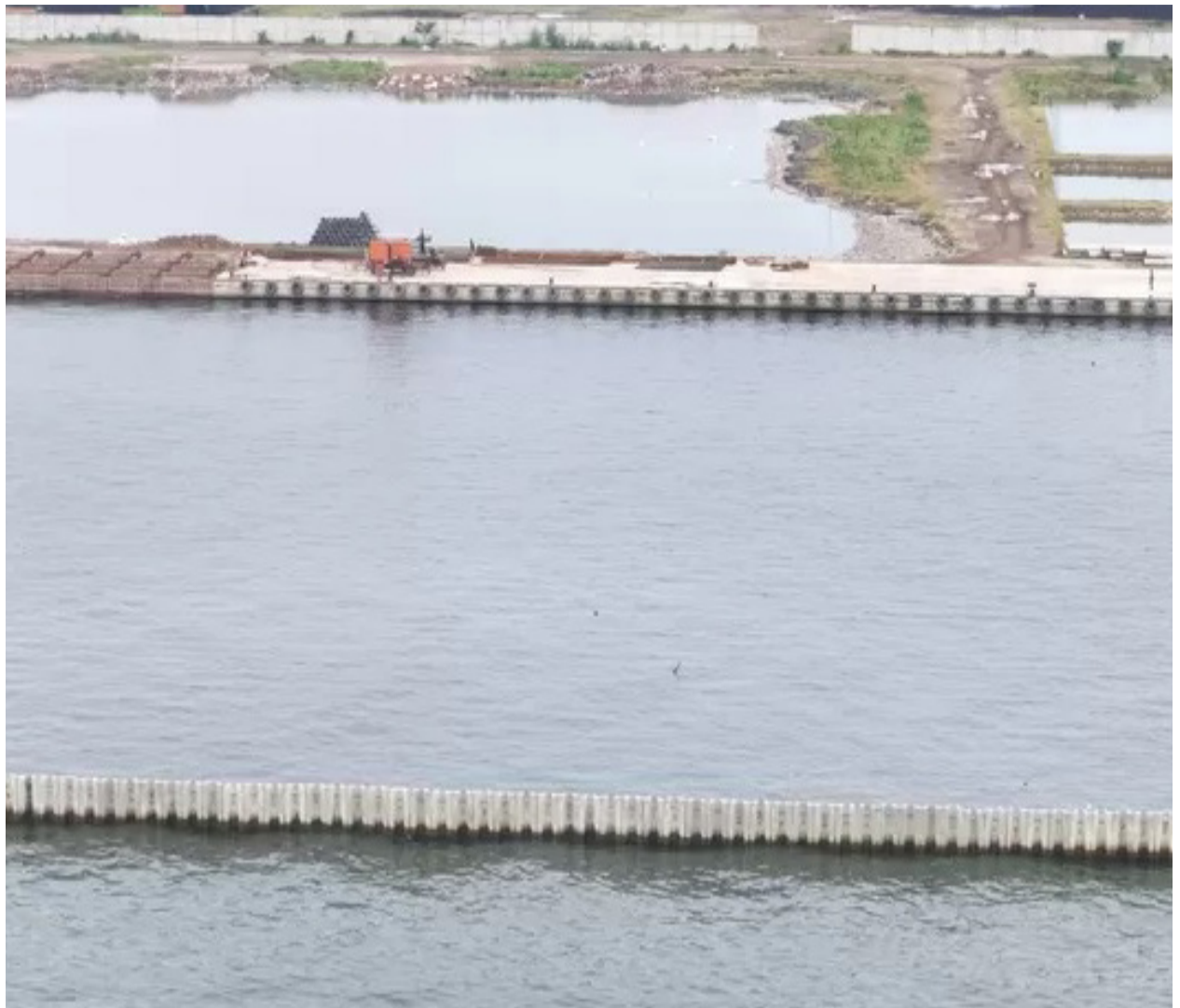
TANGGUL BETON: Video udara tanggul laut yang ramai di media sosial di kawasan cilincing, Jakarta Utara, Kamis (11/9). Pembangunan proyek di Cilincing ramai dibicarakan publik di media sosial. Sebelumnya, video terkait keberadaan tanggul beton di Cilincing beredar dan viral di media sosial. Keberadaan tanggul ini dinilai merugikan para nelayan setempat.