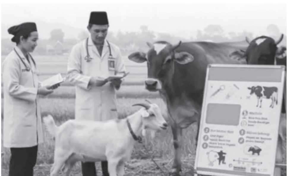
ILUSTRASI: Kontes ternak Piala Presiden 2025 Kabupaten Bogor.

Pastikan untuk mencatat tanggalnya dan hadir langsung di Lapangan Panahan Pakansari. (rbg)